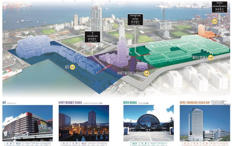
大阪ベイエリア 南港・咲洲地区の4施設

エリア一体型の大型 MICE 案件の受入体制を整え、誘致に向けて、国内やアジアの MICE 競合都市に負けまいと、南港・咲洲地区のエリアコーディネートの役割を担い、活動しています。