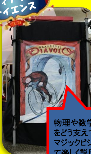
ディアブロ サイエンス

物理や数学がサーカスをどう支えているのか？マジックビジョンを使って楽しく説明します。