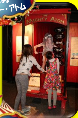
怪力男 マイティ・アトム