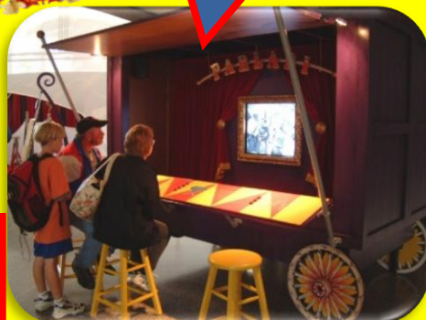
なぞなぞ サーカス

サーカスの中でしか使わないサーカス語があるんですって！誰も知らないサーカスの雑学クイズに挑戦してみましょう！