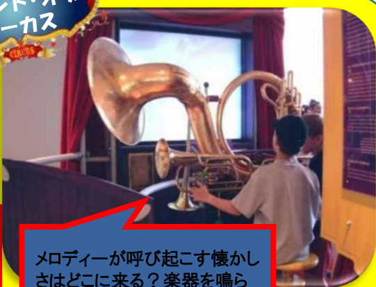
サウンド・オブ・サーカス

メロディーが呼び起こす懐かしさはどこに来る？楽器を鳴らして、音楽が脳にもたらす作用を考えてみよう！