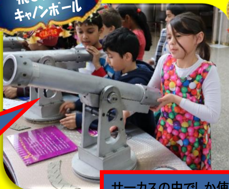
飛び出せ キャンボール

人間砲丸に見立てたボールを打ち上げよう！ どう飛ばすかより、どう着陸させるかが難しい！！