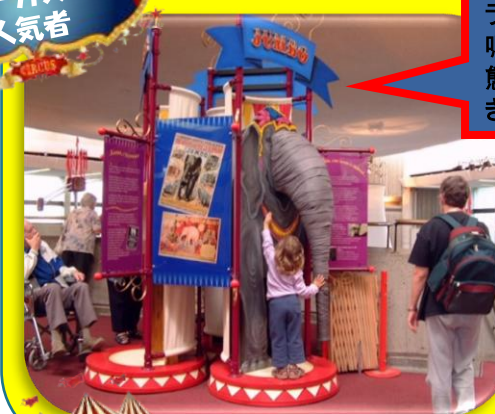
サーカスの 人気者

サーカスで活躍する象、ライオン、ゴリラ。彼らの鳴き声を聞きながら生態についても学んでいきましょう！