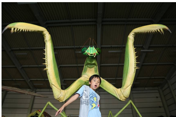
6mの動く巨大カマキリ

また、このエリアには巨大昆虫ロボットだけでなく、「クモの巣ジャングル」「カブトムシスイング」「巨大ブロック・スライダー」「牛乳パック迷路」「えんぴつトンネル」「ボルトジャンプ」・・・自分がまるで小さくなってしまったかのような世界を演出する様々なアトラクションがちりばめられています。実際の映画美術・製作スタッフが創り出す本邦初公開、オリジナルの体験型アトラクションでは登る、滑る、ぶら下がるなどワクワク、ドキドキな冒険をしながら、巨大昆虫の世界をたっぷり楽しんでください！