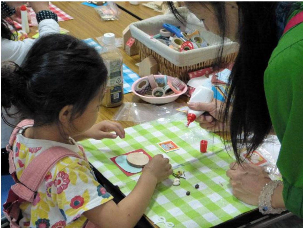
【ミニママまつり イメージ写真】