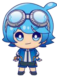
エンジニア テクノくん 二人のお友達 ロボリー