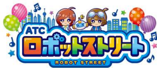
ロボットストリートのアイコン

ロボットストリートをPRするキャラクターです。ホームページ、チラシ、ポスターなどでこれらのキャラクターを露出し、近未来感と親近感を演出します。