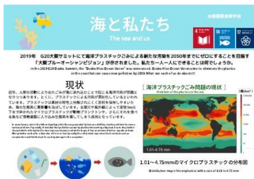
高校生作成 ポスター

全国初の公設民営(設立は大阪市、運営は学校法人大阪 YMCA)方式による中高一貫教育校。外国人教員による実践的な英語教育や国際機関・国内外の大学や企業と連携した教育活動、大阪 YMCA がもつネットワークを利用した海外大学進学や海外留学制度の活用など、民間のネットワークを活用した学校運営を行い、グローバルな舞台で活躍できる人材の育成を目指している。また、国際バカロレアが導入されており、主体的に行動できる人間へと成長できる学校を目指し、特に SDGs 教育には注力されています。