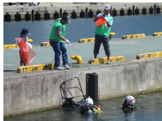
ダイバーからごみの引き上げの様子