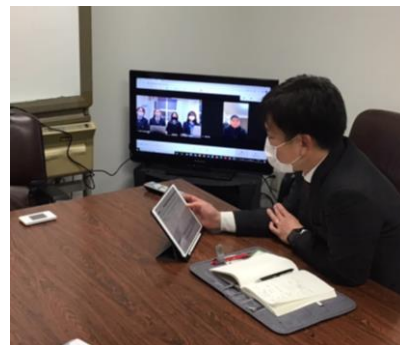
高校生×ATC オンライン MTG