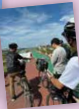
咲洲サイクル委員会