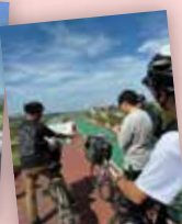
咲洲サイクル委員会