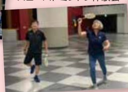
スローバドミントン体験会